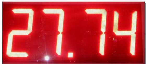
Gas Price Board